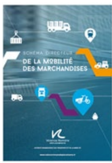
Schéma des mobilités des marchandises pour les communes couvertes par le PDU de Valence Romans Agglo ou de la CCRC